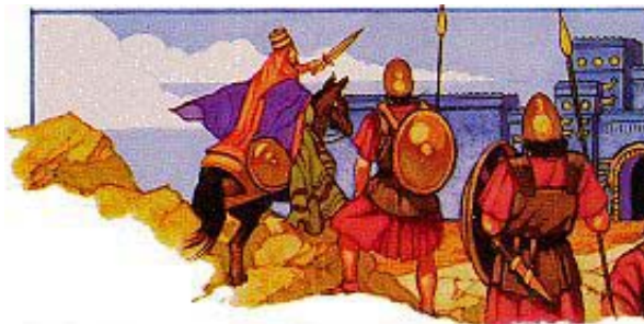
Pre nego što se Kir rodio, biblijski Božiji prorok ga je imenovao generalom koji je trebao da porazi Vavilon.

Đ. U poslednjim danima će se moral izopачiti i dohovnost opasti (2. Timotiju 3:1-5).