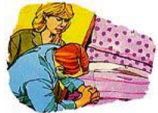
Glasno se molite jedan za drugoga.

Odgovor: Veoma je opasno da ostanete ljuti i uznemireni zbog (velikih ili malih) uvreda i nepravda. Ako se brzo ne razreše, čak i mali problemi ostavljaju utisak na vaš um, formirajući ubeđenja i stavove koji mogu negativno da utiču na celu vašu životnu filozofiju. Zato Bog kaže da, pre nego što odete na počinak, vaša ljutnja treba da se ohladi. Budite dovoljno plemeniti da oprostite i iskreno kažete: „Žao mi je.“ Na kraju, niko nije savršen, i vi oboje pripadate istom timu; stoga budite kao sportisti i pošteno priznajte pogrešku kada je načinite. Osim toga, pomirenje je vrlo prijatno iskustvo, sa neobičnim silama da zbliži bračni par. Bog predlaže da tako činite! To donosi dobre rezultate!