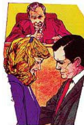
Oprostaj je uvek bolji nego razvod.

Odgovor: Biblija je jasna po tom pitanju. Bračna veza je uspostavljena da bude neraskidiva i neuništiva. Samo u slučaju preljube se razvod dozvoljava, ali ne i zahteva. Oprostaj je uvek bolji od razvoda, čak i u slučaju moralnog pada. Brak treba da traje celog života. Tako je Bog to odredio kada je u Edemskom vrtu obavio prvu svadbu. Pomisao na razvod kao rešenje će da uništi svaki brak. Zbog toga Isus nije razvod uzeo u obzir. Razvod je uvek štetan i skoro nikad nije rešenje za probleme. On stvara veće probleme, pa stoga nikad ne treba ni misliti o njemu. Posle razvoda život skoro uvek biva rastrgnut, nesrećan, zapleten i neuspešan. Bog je uspostavio brak da sačuva ljudsku čistoću i sreću, da zadovolji ljudske društvene potrebe, i da uzdigne ljudsku fizičku, umnu i moralnu prirodu. Bračni zaveti se ubrajaju u najsvečanije i najbližnje obaveze koje ljudska bića mogu na sebe da preduzmu. Omalovažavanje i neispunjavanje istih vodi ka gubljenju Božije naklonosti i blagoslova.