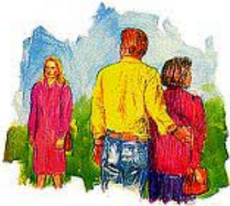
Pogrešni način mišljenja može da uništi vaš brak.

„Jer kako on tebe cijeni u duši svojoj tako ti jelo njegovo.“ (Engleski prevod: „Jer kako on misli u srcu svom, takav je.“) Priče 23:7. „Ne poželi žene bližnjega svojega.“ 2. Mojsijeva 20:17. „Svrh svega što se čuva čuvaj srce svoje, jer iz njega izlazi život.“ Priče 4:23. „Što je god istinito, ...pošteno, ... pravedno, ... prečisto, ... preljubazno, ... i još ako ima koja dobrodetelj, ... to mislite.“ Filipljanima 4:8.