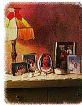
Sa Hristom u vašim srcima i domu, brak će biti uspešan.

Odgovor: To je najvažnije pravilo. Ono obuhvata sva ostala pravila. Hristu dajte prvo mesto! Stvarna tajna istinske sreće u domu nije diplomatija, strategija, niti neumorni napor u rešavanju problema, već veza sa Hristom. Srca koja su ispunjena Hristovom ljubavlju nikada ne mogu biti daleko jedno od drugog. Sa Hristom u domu, brak će biti uspešan. Evanđelje je lek za sve brakove koji su ispunjeni mržnjom, ogorčenošću i razočarenjem. Evanđelje sprečava hiljade razvoda tako što čudnovato obnavlja ljubav i sreću. Ako ste voljni, ono će sačuvati i vaš brak.