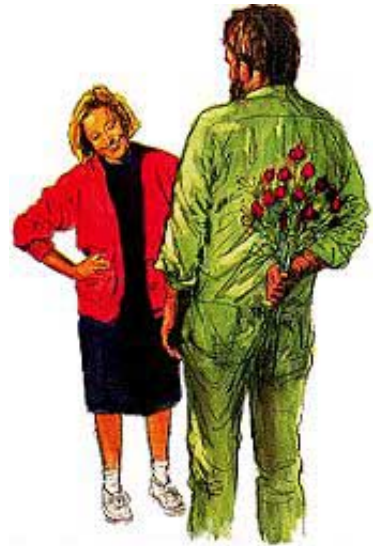
Iznenadite jednan drugoga sa malim darovima.

Odgovor: Da li je ljubav skoro iščezla iz vašeg doma? Đavo, taj poznati razvaljivač doma, je za to odgovoran. Ne zaboravite da vas je Bog spojio u brak i Njegova namjera je da zajedno ostanete i da budete srećni. On će vaše živote da ispuni srećom i ljubavlju ako živite po Njegovim pravilima, to jest, zapovestima. „Bogu je sve moguće.“ Matej 19:26. Ne očajavajte. Bog koji je u srce misionara usadio ljubav prema gubavom divljaku, je sposoban da i vama udeli ljubav jedan prema drugome, samo ako Mu to dozvolite.