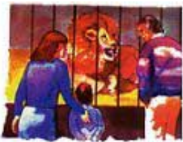
Zakon nas štiti od đavola kao što nas kavez štiti od lava u zoološkom vrtu.

„Tako govorite i tako tvorite kao oni koji će zakonom slobode biti osuđeni.“ Jakovljeva 2:12.