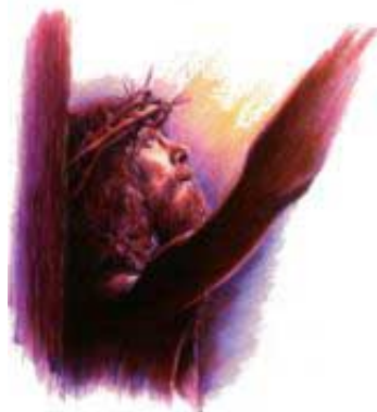
Krst je pozitivan dokaz da je zakon nepromenljiv.

„Lašnje [lakše] je pak nebu i zemlji proći, negoli jednoj titli iz zakona propasti.“ Luka 16:17. „Neću pogaziti zavjeta svojega, i što je izašlo iz usta mojih neću poreći.“ Psalmi 89:34. „Djela su ruku njegovijeh istina i pravda; vjerne su sve zapovijesti njegove. Tvrde su za vavijek vijeka, osnovane na istini i pravdi.“ Psalmi 111:7, 8.