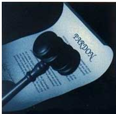
Vladarevo pomilovanje pušta zatvorenika na slobodu, ali mu ne daje pravo da prestupi nijedan zakon.

dakle? Hoćemo li griješiti [prestupati zakon], kad nijesmo pod zakonom nego pod blagodaću? Bože sačuvaj!" Rimljanima 6:14, 15. „Kvarimo li dakle zakon vjerom? Bože sačuvaj! Nego ga još utvrđujemo." Rimljanima 3:31.