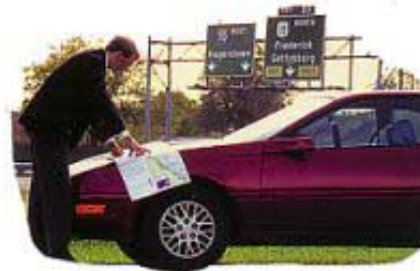
Božiji zakon je Njegova mapa za srećan i izobilan život.

Božiji zakon je kao ogledalo (Jakovljeva 1:23-25). On ukazuje na pogrešna dela u mom životu kao što ogledalo pokazuje prljavštinu na mom licu. Jedini način da osoba sazna da li greši je da brižljivo proveri svoj život prema ogledalu Božijeg zakona. Za ovu