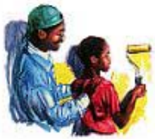
Sreća prati one koji drže Njegove zapovesti.

„Jer kroz zakon dolazi poznanje grijeha.“ Rimljanima 3:20. „Ja grijeha ne poznah osim kroz zakon; jer ne znadoh za želju da zakon ne kaza: ne zaželi.“ Rimljanima 7:7.