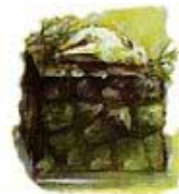
Ceremonijalne žrtve i obredi su ukazivali na Hristovu žrtvu.

Napomena: Mojsijev zakon je bio privremen ceremonijalni zakon Starog Zaveta. On je regulisao sveštenu službu, žrtve, obrede, hranu i piće za žrtve, i tako dalje. Sve je to bila senka koja je ukazivala na krst. Taj zakon je bio dodat „dok sjeme ne dođe“, što se odnosilo na Hrista (Galatima 3:16, 19). Mojsijev obredni i ceremonijalni zakon je ukazivao na buduću Hristovu žrtvu. A kada je Isus umro, taj zakon je izgubio važnost. Naprotiv, Božiji zakon od Deset Zapovesti je „tvrd za vavijek vijeka“. Psalmi 111:8. Da su to dva različita zakona, vidi još i kod Danila 9:10, 11.