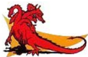
„I razgnjevi se zmija [aždaha] na ženu [istinsku crkvu].“

„I razgnjevi se zmija [aždaha, đavo] na ženu [crkvu], i otide da se pobije s ostalijem sjemenom njezinijem, koje drži zapovijesti Božije.“ Otkrivenje 12:17. „Ovdje je trpljenje svetijeh, koji drže zapovijesti Božije i vjeru Isusovu.“ Otkrivenje 14:12.