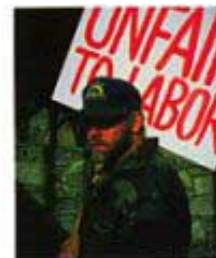
Borba između kapitala i rada je znak Isusovog drugog dolaska.

Predviđeno je da će u poslednje dane postojati problemi između kapitala i rada. Da bi se u to uverio, pogledaj samo u tvoje lokalne novine.