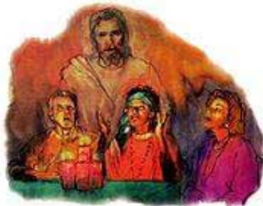
Prilikom seanse u sobi, onaj što izgleda da je Isus, je ustvari jedan od Sotoninih đavola koji oličuje Isusa.

bude moguće, i izbrane." Matej 24:24. „Zakon i svjedočanstvo tražite. Ako li ko ne govori tako, njemu nema zore [u njemu nema vidjela (engleski prevod)]." Isaija 8:20.