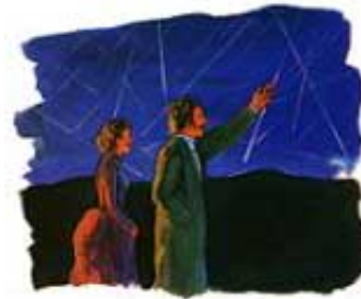
Veliko padanje zvezda (meteorska kiša) se dogodilo 13. Novembra, 1833. godine

*Peter A. Millman, „Padanje Zvezda”, Teleskop , 7 (Maj-Juni, 1940) 57.