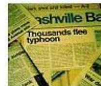
Stah od budućnosti je znak Isusovog povratka.

To čudno nalikuje na članke iz dnevnih novina--savršena slika današnjeg sveta--a za to ima i razloga: Mi smo ljudi poslednjih dana ovozemaljske istorije. Ne treba da nas iznenađuje napeta atmosfera koja vlada u današnjem svetu. Hristos je to preokao. To treba da nas ubedi da je Njegov dolazak blizu.