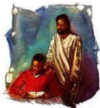
Nikada ne treba da budemo tako zauzeti, da nemamo vremena za Hrista.

Odgovor: Isus kaže: „Evo stojim na vratima i kucam: ako ko čuje glas moj i otvori vrata, ućiću k njemu i večeraću s njime, i on sa mnom." Otkrivenje 3:20. Posredstvom Svetoga Duha i moje savesti, Isus kuca i traži da uđe u moje srce da bi mogao da promeni moj život. Ako ja Njemu potpuno predam svoj život, On će izbrisati sve grehe moje prošlosti (Rimljanima 3:25) i daće mi silu da živim pobožnim životom (Jovan 1:12). I kao besplatan dar, On meni sada udeljuje Njegov pravedni karakter, da bi bez straha mogao da stanem pred Bogom. Kada Isus promeni moj život, izvršavanje Njegove volje postaje zadovoljstvo. To je tako jednostavno da mnogi čak i sumnjaju da je to moguće. Ali to je istina. Sa moje strane ja treba jednostavno da predam Hristu moj život i da Mu dozvolim da On u meni boravi. Njegov deo je da na čudnovat način promeni moj život i pripremi me za Njegov drugi dolazak. To je besplatni dar. Ja samo treba da ga prihvatim.