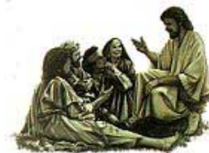
Isus je učio da će On doći na ovu zemlju po drugi put.

Odgovor: Jeste! Kod Mateje 26:64, Isus pod zakletvom svedoči da će On ponovo doći na ovu zemlju. S obzirom da je Sveto Pismo pouzdano (Jovan 10:35), Njegov drugi dolazak je siguran. To Hristos lično garantuje.