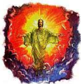
Isus je rekao da će se na oblacima On vratiti na ovu zemlju.

„I ovo rekavši vidješe oni gdje se podiže i odnese ga oblak iz očiju njihovijeh. I kad gledahu za njim gdje ide na nebo, gle, dva čovjeka stadoše pred njima u bijelijem haljinama, koji i rekoše: ljudi Galilejci! Šta stojite i gledate na nebo? Ovaj Isus koji se od vas uze na nebo tako će doći kao što vidjeste da ide na nebo.“ Djela Apostolska 1:9-11.