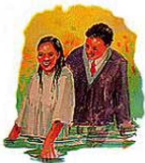
Krštenje je slavni događaj jer simbolički pretstavlja pogreb starog grešnog života i početak novog života u Hristu.

„I sad šta oklijevaš? Ustani i krsti se, i operi se od grijeha svojijeh, prizvavši ime Gospoda Isusa.“ Djela Apostolska 22:16.