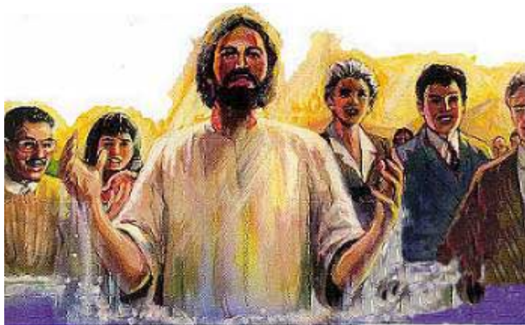
Ako Isus tebi lično govori da se krstiš nemoj da oklevaš. Krštenje je javni izraz tvoje želje da potpuno slediš Isusa.

Četvrto: Krštenje ne garantuje spasenje. To nije magični obred. Spasenje dolazi samo od Hrista kao besplatni dar, kada se iskusi nanovo rođenje. Krštenje je simbol istinskog obraćenja; i ako obraćenje ne prethodi krštenju, obred krštenja je beznačajan.