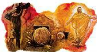
Krštenjem ja potvrđujem moju veru u Isusovu smrt, pogreb i vaskrsenje.

„Tako se s njim pogrebosmo krštenjem u smrt da kako što usta Hristos iz mrtvih slavom očinom, tako i mi u novom životu da hodimo. Jer kad smo jednaki s njim jednakom smrću, bićemo i vaskrsenjem; znajući ovo da se stari naš čovjek razape s njime, da bi se tijelo grješno pokvarilo, da više ne bismo služili grijehu.” Rimljanima 6:4-6.