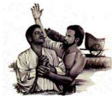
Filip je krstio rizničara Etiopije istoga dana kada je on prihvatio Hrista kao svog Spasitelja.

Izvesno je da istinski obraćena osoba ne bi htela da odugovlači sa krštenjem, jer se njime javno odaje priznanje Isusu za proizvođenje svih tih čuda.