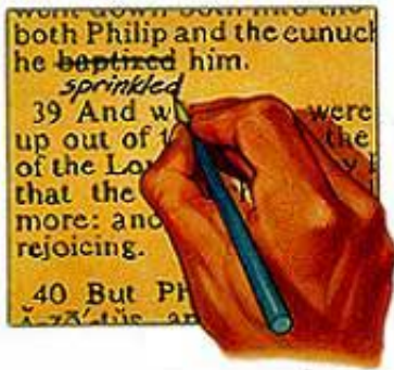
Sve forme krštenja koje se razlikuju od zagnjurenja dolaze od ljudi, radije nego od Svetog Pisma.

„No zaludu me poštuju učeći naukama i zapovijestima ljudskima.” Matej 15:9.