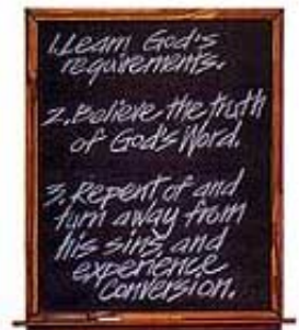
Pre nego što se krsti, osoba mora da ispuni tri jednostavna uslova.

V. Da se pokaje, ostavi greh i obrati. „Pokajte se, i da se krstite svaki od vas u ime Isusa Hrista za oprostjenje grijeha.” Djela Apostolska 2:38. „Pokajte se dakle, i obratite se da se očistite od grijeha svojijeh.” Djela Apostolska 3:19.