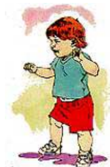
Novi Hrišćani su kao mala deca koja uče da hodaju. Oni se ponekad skliznu i padnu.

Odgovor: To je isto kao reći da beba ne treba pokušati da hoda dok ne bude sigurna da se nikada neće okliznuti i pasti. Hrišćanin je „novorođenče“ u Hristu. Zbog toga se obraćenje naziva „novo rođenje“. Za Božije dete više ne postoji ružna grešna prošlost. Prilikom obraćenja je Bog oprašta i zaboravlja. Krštenje simbolički pretstavlja pogreb starog života. Mi počinjemo hrišćanski život kao bebe, a ne kao odrasli. Bog nam sudi prema našem stavu i životnom pravcu, radije nego po nekoliko oklizanja i padanja koji mogu da nam se dogode kao nezrelim Hrišćanima.