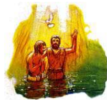
Isus je bio kršten zagnjurenjem.

Odgovor: Zagnjurenjem! Primeti da je On posle obreda „izašao iz vode“. Isus je bio kršten u reci Jordanu, a ne na obali. Jovan je uvek nalazio mesto za krštenje gde je bilo „mnogo vode“ (Jovan 3:23), dovoljno za zagnjurenje. Biblija naređuje da sledimo Isusov primer (1. Petrova 2:21). Osim zagnjurenja, svako drugo krštenje prestupa tu zapovest. Reč krštenje dolazi od grčke reči „baptizo“, što znači „duboko unutra, ili zagnjuriti“. U Novom Zaveću postoji osam različitih grčkih reči koje su se koristile da opišu upotrebu tečnosti. Među tim rečima, kao na primer, prskanje, polivanje, zagnjurenje, i tako dalje, samo reč „zagnjurenje“ ili „baptizo“ je upotrebljena da opiše krštenje.