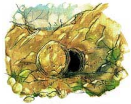
Car David će biti spašen u Božijem carstvu. Međutim, on je sada u svom grobu, gde očekuje vaskrsenje.