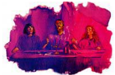
Mrtvi ne mogu da saobraćaju sa živima, mada milioni ljudi misle da je to moguće.

Odgovor: Ne, mrtvi ne mogu da saobraćaju sa živima, niti oni znaju šta živi rade. Oni su mrtvi. Njihove misli su propale (Psalmi 146:4).