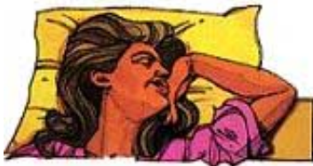
Isus smrt naziva „snom“. To je stanje potpune nesvesnosti.

„Tako čovjek kad legne, ne ustaje više; dokle je nebesa neće se probuditi.“ Jov 14:12. „Ali će doći dan Gospodnji ... u koji će nebesa s hukom proći.“ 2. Petrova 3:10.