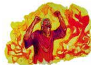
Grešnici će biti bačeni u pakleni oganj na kraju sveta -- a ne kad umru.

Odgovor: Ne kad umru, već na kraju sveta -- na dan velikog suda -- će grešnici biti bačeni u pakleni oganj. Bog neće da kazni nijednu osobu u ognju dok se na kraju sveta njen slučaj ne razmotri na sudu. Niti će on da kazni 5.000 puta više ubicu koji je umro pre 5.000 godina, nego ubicu koji danas umre, a zaslužuje istu kaznu.