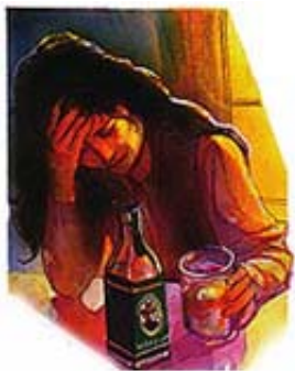
Sveto Pismo jasno osuđuje upotrebu alkoholnih pića.

„Vino je potsmjevač i silovito piće nemirnik, i ko god za njim luta neće biti mudar.“ Priče 20:1. „Ne gledaj na vino kad se rumeni, kad u čaši pokazuje lice svoje i upravo iskače. Na posljedak će kao zmija ujesti i kao aspida upeći.“ Priče 23:31, 32. „Ni kurvari ... ni pijanice ... carstva Božijega neće naslijediti.“ 1. Korinćanima 6:9, 10.