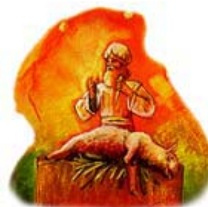
Nojevo žrtvovanje čistih životinja (1. Mojsijeva 8:20) pokazuje da je on razumeo razliku između čistog i nečistog.

Odgovor: Ne uopšte! Biblija pruža obilje dokaza da čiste i nečiste životinje postoje još od vremena Stvaranja. Noje je živeo mnogo godina pre nego što su Jevreji nastali, i on je znao za čisto i nečisto, jer je u kovčeg uneo po „sedam“ parova od čistih i po „jedan“ par od nečistih životinja. Otkrivenje 18:2 spominje i neke nečiste ptice pre Hristovog drugog dolaska. Hristova smrt u niukom slučaju ne menja te zdravstvene zakone. Biblija kaže da će svi koji te zakone krše biti uništeni kad Isus ponovo dođe (Isaija 66:15-17). Probavni sistem Jevreja se uopšte ne razlikuje od onog koji neznabošci imaju. Ti zdravstveni zakoni važe za sve ljude u svim vremenima.