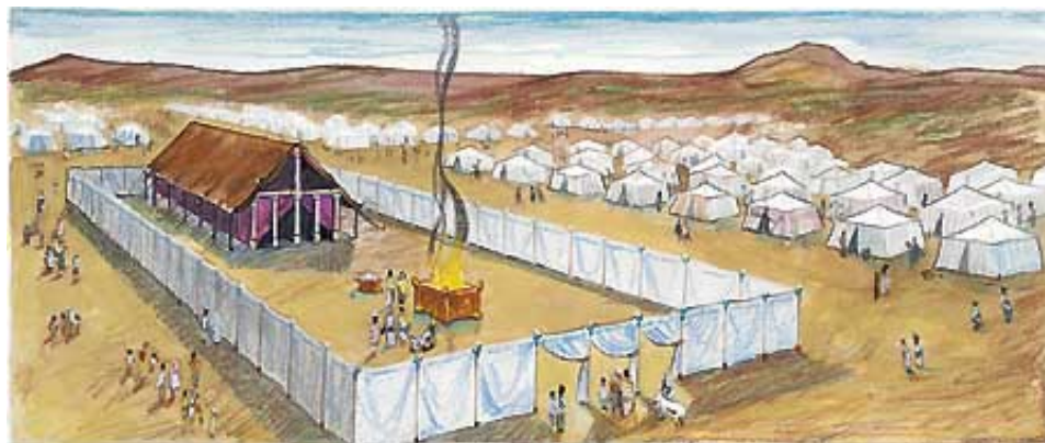
Sam Bog je dao Mojsiju planove ili nacrt za svetinju.

Svetinja je bila elegantna struktura u obliku šatora (otprilike 13,5 m dugačka i 4,5 m široka, na osnovu 1 lakat=0,46 m). U njoj su se obavljale posebne službe i Božija natprirodna prisutnost je tu boravila. Zidovi su bili načinjeni od bagremovih dasaka, postavljenim na srebrnim postoljima i okovanim zlatom (2. Mojsijeva 26:15-19, 29). Krov je bio načinjen od četiri vrste pokrivala ili zavesa: od lanenog materijala, kozje dlake, i od ovnujske i jazavčeve kože (2. Mojsijeva 26:1, 6-14). Taj šator je imao dve prostorije: svetinju i svetinju nad svetinjama. Teška, debela zavesa je razdvajala te dve prostorije. [Primeti da se u srpskoj Bibliji svetinjom naziva ili cela građevina, ili samo šator, ili samo prva prostorija u šatoru, zavisno od smisla upotrebe.] Predvorje ili trem koji se nalazio oko šatora je bio otprilike 45 m dugačak i 22,5 m širok (2. Mojsijeva 27:18). On je bio ograđen zavesama od finog lanenog platna, koje su bile obešene na 60 bronzanih stubova (2. Mojsijeva 27:9-16).