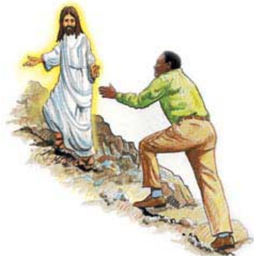
Naša uloga u spasenju je da radosno i voljno sledimo Isusa kuda On vodi.

Mnogi misle da će Isus da primi u nebo sve koji ispovedaju spasenje, bez obzira na njihov način življenja. Nažalost, to nije tako. Sotona je to izmislio. Hrišćanin mora da sledi Hristov način života (1. Petrova 2:21). Sila Isusove prolivene krvi može da nas do toga dovede (Jevrejima 13:12) jedino ako Mu dopustimo da kontroliše naše živote, i ako sledimo kuda On vodi, pa čak i ako bi put bio stenovit i neuglađen (Matej 7:13, 14, 21).