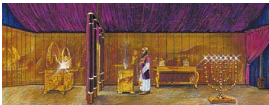
Svetinja i službe u njoj su prikazivale plan spasenja.