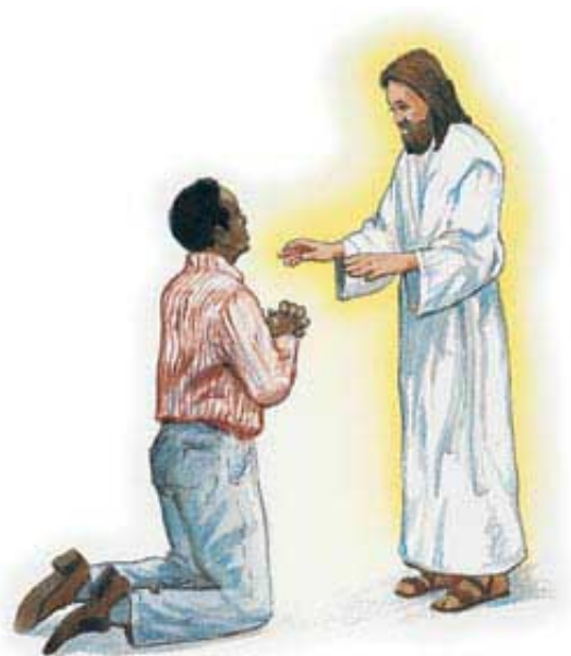
Na čudnovat način će Isus proizvesti da radosno činimo samo ono što je ugodno Bogu.

Isus je spreman da ispuni sva ta slavna obećanja i u tvome životu. Da li si i ti spreman (spremna)? Klekni sada na kolena i zamoli Isusa da preuzme kontrolu nad tvojim životom. On te neće razočarati.