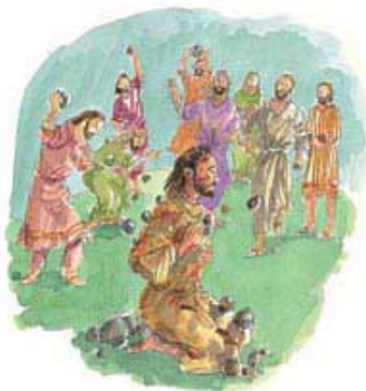
Posle Stefanove smrti kamenovanjem, učenici su počeli da propovedaju evanđelje neznabošcima.

Odgovor: Oni su počeli da propovedaju evanđelje drugim narodima i nacijama sveta (Djela Apostolska 13:46). Pobožni đakon, Stefan, je javno bio kamenovan 34. godine posle Hrista. Od tada Jevreji nisu više bili smatrani Božijim izabranim narodom, jer su odbacili Isusa i Božiji plan. Umesto njih, Bog sada smatra kao duhovne Jevreje ljude svih nacija koji Ga prihvate i služe Mu. Oni su sada Njegov izabrani narod i „naslednici prema obećanju“. U te duhovne Jevreje se, naravno, ubrajaju i svi Jevreji koji pojedinačno prihvate Isusa i suže Mu (Galatima 3:27-29; Rimljanima 2:28, 29).