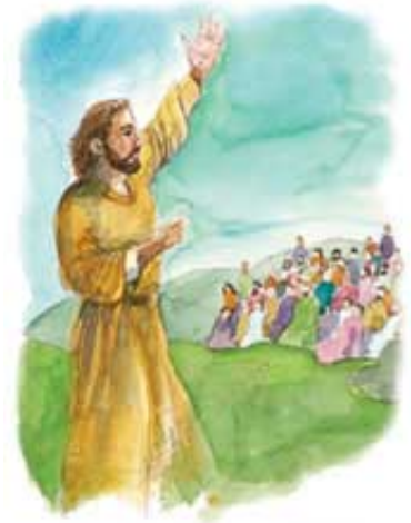
Učenici su propovedali mnogim Jevrejima.

Odgovor: Zavet je Njegova blagoslovena saglasnost da spase ljude od njihovih greha (Jevrejima 10:16, 17). Kad se Njegova služba od tri i po godine završila, Isus je potvrdio zavet posredstvom Svojih učenika (Jevrejima 2:3). On ih je najpre poslao Jevrejskoj naciji (Matej 10:5, 6), jer je Njegov izabrani narod imao još priliku da se pokaje za vreme poslednjih tri i po godine perioda od 490 godina.