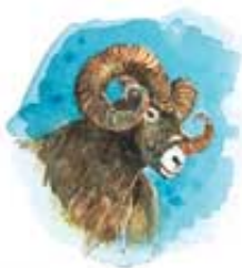
Ovan pretstavlja Medo-Persiju.

„Ovan što si ga vidio, koji ima dva roga, to su carevi Midski i Persijski.“ Danilo 8:20.