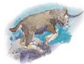
Jarac simbolizira Grčku.

„A runjavi je jarac car Grčki; i veliki rog što mu bješe među očima, to je prvi car. A što se on slomi, i mjesto njega narastoše četiri, to su četiri carstva, koja će nastati iza toga naroda.“ Danilo 8:21, 22.