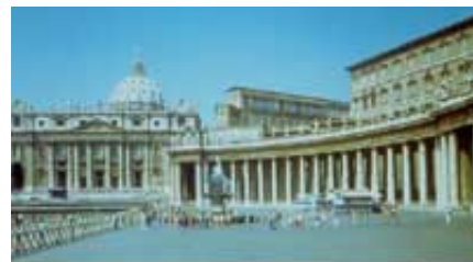
„Mali rog“ iz Danila 8. glave predstavlja Rim, kako paganski, tako i papski. Prema tome, mali rog poslednjih dana se odnosi na papstvo.

uključujući tu većinu vođa Reformacije, su verovali da je mali rog predstavljao Rim, kako paganski, tako i papski. Da razmotrimo biblijske dokaze u prilog toga: