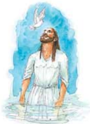
Isusovo krštenje je bilo tačno ispunjenje biblijskog proročanstva.