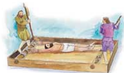
Sila malog roga je progonila i uništila milione Božijih ljudi.

Odgovor: Odgovor sa neba je bio da je nebeska svetinja trebala da se očisti posle isteka 2.300 proročkih dana, odnosno 2.300 bukvalnih godina. (15. Lekcija daje objašnjenje o tom „dan-za-godinu“ proročkom principu, koji je spomenut kod Jezekilja 4:6 i u 4. Mojsijevoj 14:34.) Već smo razumeli da se u starom Izrailju čišćenje zemaljske svetinje vršilo jednom godišnje na dan pomirenja.