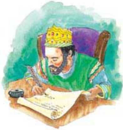
Car Artakseks je odobrio obnovu Jerusalima u 457. godini pre Hrista.

Odgovor: Događaj kojim je taj period započeo je bio oglas persijskog cara Artakserksa da se Božijem narodu u ropstvu u Medo-Persiji odobri povratak u Jerusolim da obnovi grad. Taj oglas, zabeležen kod Jezdre u 7. glavi, je bio izdat 457. godine pre Hrista, ili sedme godine careve vladavine, a stupio je na snagu u jesen iste godine. Artakserks je postao vladar 464. godine pre Hrista.