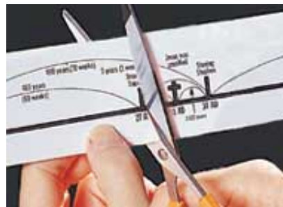
Zašto bi iko otekao važan deo tog proročanstva?

To je važan ključ za uspeh. Božiji način je uvek bilo u slobodi izbora (Isus Navin 24:15). I mada On želi da spase svaku osobu (1. Timotiju 2:3, 4), On ipak dozvoljava slobodni izbor (5. Mojsijeva 30:19). Bog je dozvolio Sotoni da se pobuni protiv Njega. On je isto dozvolio Adamu i Evi da izaberu neposlušnost. Pravednost nije nikada nepromenljiva programirana provizija koja će da me odvede u nebo, bez obzira kako ja živim, i da li sam ja za nebo uopšte zainteresovan. Izbor znači da sam ja uvek slobodan da promenim mišljenje. Isus traži da izaberem Njega (Matej 11:28-30) i da taj izbor svakodnevno potvrđujem (Psalmi 86:3). Ako ja svakoga dana Njega biram, On će da me promeni u Svoj lik i konačno odvede u Njegovo blagosloveno novo carstvo. Ali, molim te, imaj na umu da sam ja