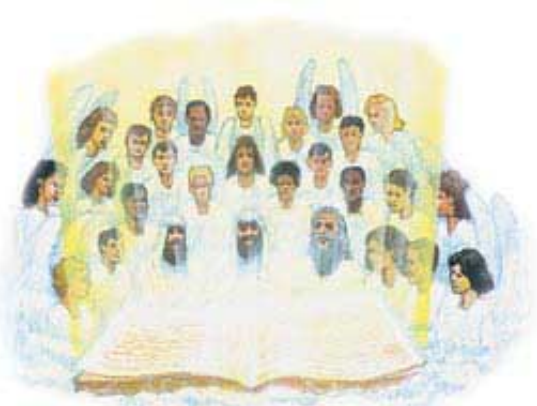
Božiji sveti svih vekova će da učestvuju u drugoj fazi suda.

Pretpostavimo da članovi neke porodice otkriju da u nebu nije njihov ljubljeni sin koji je bio ubijen. Ali ubica jeste. Bez sumnje, oni bi se tome čudili. Druga faza suda će da pruži odgovore na sva pitanja pravednika. Oni će brižljivo da ispitaju živote svih izgubljenih osoba (uključujući tu i Sotonu i njegove anđele), i na kraju će potpuno da se saglase sa Isusovom odlukom u vezi sa svačijom nagradom. Svima će postati jasno da sud nije bio proizvoljan. On je jednostavno potvrdio odluke koje su ljudi sami doneli, da služe ili Isusu ili drugom gospodaru (Otkrivenje 22:11, 12). (Osvrni se na 12. Lekciju za detalje u vezi sa 1.000-godišnjim periodom.)