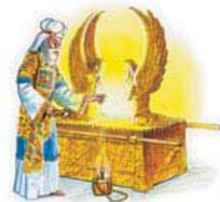
Sveštenikova služba pred sedištem milosti je predstavljala Isusovu službu u nebu za nas.

E. Svi su onda bez greha počinjali novu godinu.