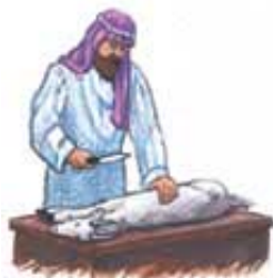
Žrtvovana životinja je predstavljala Isusovu žrtvu na krstu.