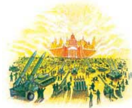
Grešnici će pokušati da napadnu sveti grad.

započne silnu propagandnu kampanju da ih zavede. Začuđujuće je to što će on uspeti da sve narode i nacije na zemlji ubedi da je moguće zauzeti sveti grad.