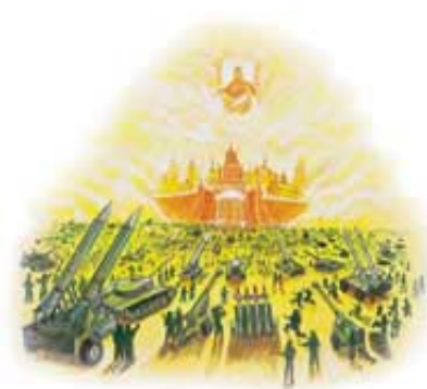
Treća faza suda će da poremeti plan za napad na grad.

Odgovor: Iznenada i bez najave, Bog se pojavljuje nad gradom u Svojoj skoro paralizujućoj svetlosti (Otkrivenje 19:11-21). Čas istine je došao. Svaka izgubljena duša od postanja sveta, uključujući tu i Sotonu sa svojim anđelima, se sada suočava sa Bogom na sudu. Svako oko je upereno u Cara nad carevima (Otkrivenje 20:12).