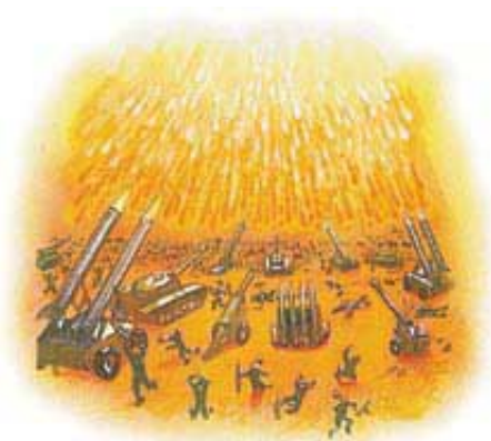
Oganj s neba će zauvek da uništi greh i grešnike.

Zatim će Gospod da obriše svaku suzu iz očiju Svog spašenog naroda (Otkrivenje 21:4), i stвориće za Svoje svete nova nebesa i neiskazano lepu novu zemlju. A najbolje od svega, Bog će tu da živi sa Svojim narodom kroz večnost. Nijedna razumna osoba ne bi trebala to da propusti.