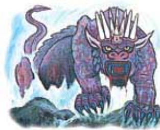
Zver iz Otkrivenja 13. glave simbolizira Antihrista.

More (ili voda) u proročanstvu pretstavlja ljude, ili gusto naseljene teritorije (Otkrivenje 17:15). Prema tome, zver, ili Antihrist, je trebao da proizađe iz postojećih nacija tada poznatog sveta. Kao što smo već saznali, papstvo je proizašlo iz zapadne Evrope, pa prema tome odgovara ovoj tački opisa.