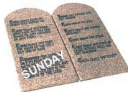
Promena Subote u Nedelju zahteva promenu Božijeg zakona, a to je vrlo ozbiljna stvar.

Mi pitamo papstvo: „Da li ste vi zaista promenili Subotu u Nedelju?” Ono odgovara: „Da, jesmo. To je naš simbol ili žig autoriteta i sile.”