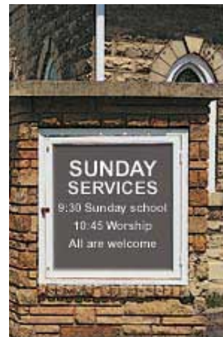
Nedelja kao sveti dan je zverin žig ili simbol autoriteta.