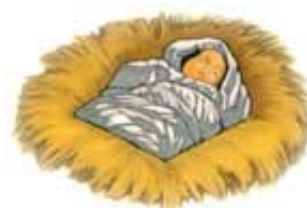
Car Irod je pokušao da „proždere“, ili ubije Isusa kad se On rodio.

Da bismo saznali ko je aždaha, pogledajmo 12. glavu Otkrivenja u kojoj je Božija crkva poslednjeg vremena predstavljena kao čista žena. U proročanstvu, čista žena predstavlja pravi Božiji narod ili crkvu (Jeremija 6:2; Isaija 51:16). (U 23. Lekciji će detaljno biti prikazana Božija crkva poslednjeg vremena, spomenuta u Otkrivenju 12. glavi. 22. Lekcija će da objasni 17. i 18. glavu Otkrivenja, u kojima su pale crkve simolički predstavljene kao pala majka sa svojim palim ćerkama.) Čista žena je bila trudna i spremna da se rodi. Aždaha se blizu šunjala, u nadi da „proždere“ njenu bebu kad se rodi. Međutim, kada se rodila muška beba, Ona je izbegla aždahu, ispunila Svoju misiju i uznela se na nebo. Očigledno je da se to odnosi na Isusa, koga je Irod pokušao da uništi kada je naredio da se pogube sve bebe u Vitlejemu (Matej 2:16). Prema tome, aždaha predstavlja paganski Rim, u kojem je Irod bio car. Sila u pozadini Irodovog plana je, naravno, bio đavo (Otkrivenje 12:7-9). Sotona deluje kroz različite vlasti da izvrši svoj odvratni posao--u ovom slučaju, kroz paganski Rim.