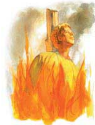
Milioni Hrišćana su izgubili živote za vreme progonstva od strane papstva.

Očigledno je da je rana isceljena i da su oči svih nacija uperene u Vatikan. Prema tome, i ova tačka odgovara papstvu.