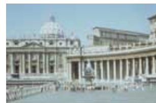
Više od 100 nacija ima

Odkako je isceljenje započelo, papska sila je porasla i ojačala, dok nije danas postala jedna od najmoćnijih religijsko-političkih organizacija i uticajnih centara u svetu. Malakaj Martin, odani Vatikanski poverenik i stručnjak za inteligenciju, otkriva sledeće u svojoj