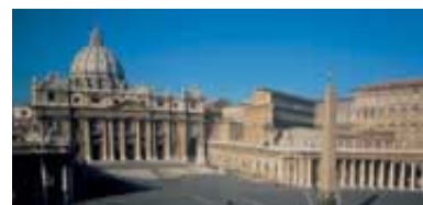
Papstvo je Antihrist.

Četiri zveri iz Danila 7 su prikazane kao delovi zveri koja se odnosi na Antihrista, a to je zbog toga što je papstvo preuzelo verovanja i običaje iz svih četiri pređašnjih imperija. Ta verovanja i običaje je papstvo ogrnulo duhovnim plaštem i u svet poslalo kao hrišćansku nauku. Evo jednog od mnogih istorijskih dokaza u prilog toga: „U izvesnom smislu je ono [papstvo] sebe organizovalo po ugledu na Rimsku imperiju, sačuvalo je i unapredilo filozofske institucije Sokrata, Platona i Aristotela, pozajmilo je neke stvari od Varvara i Vizantijske Rimske imperije, ali ono uvek ostaje posebno, dok potpuno preživa te elemente uzete iz spoljašnjih izvora.“ 1 Ova tačka definitivno odgovara papstvu.