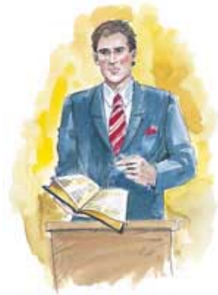
Religijske vođe koje ignorišu Božiju svetu Subotu će da osete Božiji gnjev.

E. Bog svečano opominje da će Njegov gnjev da osete sve vođe koje uče da nema razlike između svetih stvari (kao što je Božija sveta Subota) i običnih stvari (kao što je to Nedelja) (Jezekilj 22:26, 31).