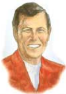
Čelo je simbol razuma, ili misli. Ljudi će biti žigosani na svojim čelima ako drže Nedelju kao sveti dan.

Odgovor: Čelo pretstavlja razum, to jest, misli (Jevrejima 10:16). Osoba će biti žigosana na čelu svojom odlukom da svetkuje Nedelju. Ruka je simbol rada (Propovjednik 9:10). Osoba će biti žigosana na ruci ako radi na Božiji sveti dan Subotni, ili saglasnošću da udovolji Nedeljnom zakonu iz praktičnih razloga (posao, familija, i tako dalje). Znak, ili žig, bilo Božiji ili zverin, neće biti vidljiv ljudima. U suštini, ti ćeš sebe da žigošeš primanjem ili Božijeg znaka ili žiga--Subote, ili zverinog žiga--Nedelje. Iako to drugi ljudi neće moći da vide, Bog će znati ko ima koji znak ili žig (2. Timotiju 2:19).