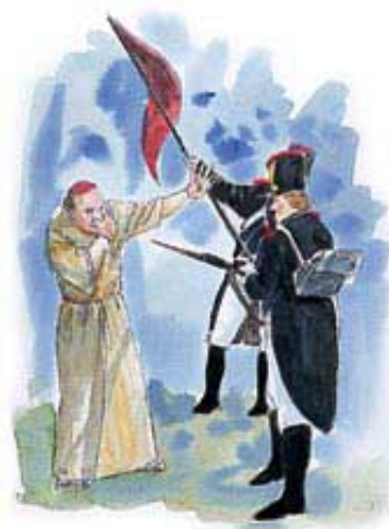
General Berthier je papstvu naneo smrtnu ranu kada je zarobio papu Pija VI.

Prema tome, ova tačka isto odgovara papstvu.