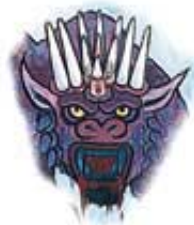
Otkrivenje 13 daje opis 11 obeležja te zveri.