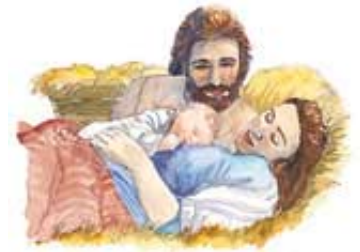
Beba spomenuta u Otkrivenju 12 je Isus.

4. Otkrivenje 12:3, 4 predstavlja „veliku crvenu aždahu“ koja je mrzela „muško dete“ i pokušala da ga ubije neposredno posle rođenja. Verovatno se sećaš aždaha spomenute u 20. Lekciji. Koga predstavlja ta aždaha?