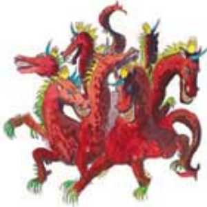
Velika crvena aždaha je Sotona koji je za vreme Isusovog rođenja delovao kroz paganski Rim.

4. Otkrivenje 12:3, 4 predstavlja „veliku crvenu aždahu“ koja je mrzela „muško dete“ i pokušala da ga ubije neposredno posle rođenja. Verovatno se sećaš aždaha spomenute u 20. Lekciji. Koga predstavlja ta aždaha?