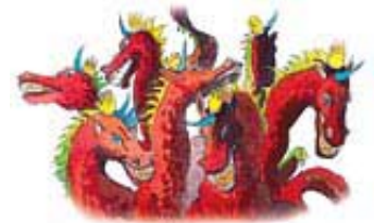
Sedam glava simboliziraju sedam brežuljaka na kojima je Rim bio sagrađen. 10 rogova simboliziraju 10 nacija na zemlji.

B. „Deset rogova“ predstavljaju vlasti, ili nacije, koje podržavaju glavne sile koje tlače Božiji narod i Njegovu crkvu. Za vreme paganske Rimske vladavine (Otkrivenje 12:3, 4), ti rogovi su se odnosili na 10 barbarskih plemena koja su podržavala papstvo i koja su Rimsku imperiju dovela do pada (Danilo 7:23, 24). Od tih plemena je kasnije nastala moderna Evropa. U poslednjim danima se deset rogova odnosi na sve nacije sveta, ujedinjene u koaliciju (Otkrivenje 16:14; 17:12, 13, 16), a koje podržavaju „Vavilon Veliki“ u njegovoj borbi protiv Božijeg naroda.