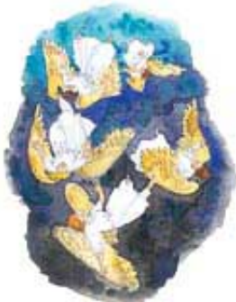
„Jedna trećina zvezda“ se odnosi na pobunjene anđele koji su, zajedno sa Luciferom, bili zbačeni sa neba.