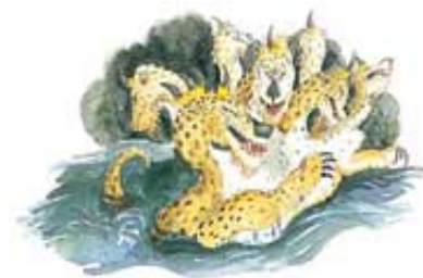
Zver prikazana u Otkrivenju 13:1-10 simbolički pretstavlja papstvo.

Odgovor: Zver sa sedam glava (Otkrivenje 13:1-10) se ne odnosi ni na kog drugog, osim na Rimsko papstvo. (Pogledaj 15. Lekciju koja detaljno razrađuje tu temu.) Seti se da zveri u biblijskom proročanstvu simboliziraju nacije ili svetske sile (Danilo 7:17, 23).