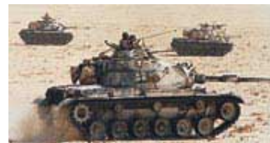
Amerika je najveća svetska vojna sila.

Kada je marksistička grupa svrgnula vlast u Etiopiji, od Amerike se tražilo da posreduje. Kada je Boris Jelšin postao predsednik nove nezavisne Rusije, on je prvo posetio Ameriku. Bivši predsednik Sovjetskog Saveza, Mikhail Gorbačev, se u svojoj krizi obratio Americi. Kada je Kuvajt bio napadnut, njegova vlast je pozvala Ameriku u pomoć. Američki rat u Iraku je skoro ceo svet podržavao. Korespondent Javnog Nacionalnog Radija je američkog predsednika nazivao „predsednikom sveta“. Mi sada imamo „vrlo neobičnu svetsku strukturu, sa Sjedinjenim Američkim Državama kao jedinom silom na vrhu internacionalnog sistema.“ Krauthammer, Nova Republika , s. 23.