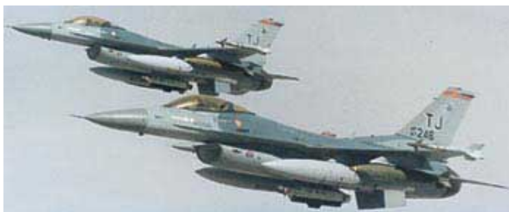
Sve nacije sveta se sada obraćaju Sjedinjenim Američkim Državama za zaštitu i pomoć.