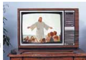
A najveće čudo od svega će biti kad se Sotona prikaže kao Isus.

Verujući da je Sotona Isus, milijarde ljudi će da mu se poklone i pridruže lažnom