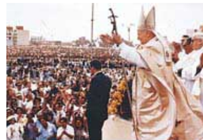
Papa je izuzetno popularni svetski vođa.