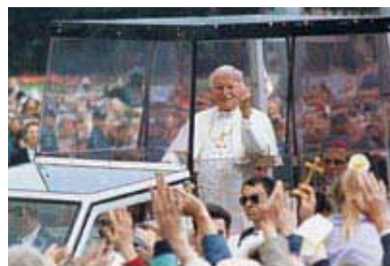
Papstvo je najjača religijsko-politička sila sveta.

Đ. Gorbačev je rekao: „Sve što se dogodilo u Istočnoj Evropi poslednjih godina ne bi bilo moguće bez papinog napora i ogromne uloge koju je on odigrao na svetskoj pozornici." Mikhail Gorbačev, Zvezda Toronto , 9. Mart, 1992.