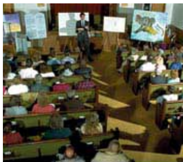
U poslednjim danima na zemlji će Božija vest nade da dospe do svake osobe.