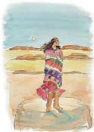
Proročanstvo je predvidelo nastajanje Amerike na retko naseljenoj teritoriji.

Odgovor: Ova nacija je izašla „iz zemlje“, a ne iz vode, kao što je to bio slučaj sa drugim nacijama spomenutim u Danilu i Otkrivenju. Prema Otkrivenju znamo da vode simboliziraju gusto naseljene svetske oblasti. „Vode što si vidio, gdje sjedi kurva, ono su ljudi i narodi, i plemena i jezici.“ Otkrivenje 17:15. Prema tome, zemlja pretstavlja nešto sasvim suprotno. Proročanstvo kaže da je ta nova nacija trebala da proizađe iz oblasti koja je bila skoro nenastanjena pre završetka 18. veka. Dakle, ona nije mogla da proizađe iz pretrpanih i borbom rastrgnutih nacija staroga sveta, već je trebala da se pojavi na retko naseljenom kontinentu.