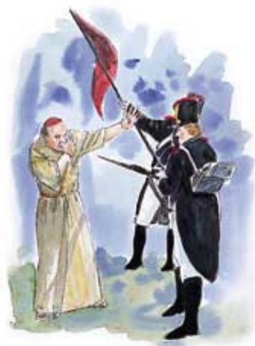
1798. je Napoleonov general Berthier naneo smrtnu ranu papstvu, kada je zarobio papu.

„I dana joj bi oblast da čini četrdeset i dva mjeseca.“ Otkrivenje 13:5.