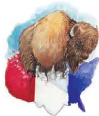
Zver iz Otkrivenja 13:11-18 simbolički pretstavlja Ameriku.

Odgovor: U 10. stihu spomenuto zarobljavanje pape se odigralo 1798. godine. U to vreme je (prema 11. stihu) nova sila trebala da se pojavi na scenu. Sjedinjene Američke Države su 1776. objavile svoju nezavisnost, 1787. izglasale Ustav, 1791. usvojile Akt o Pravima, a 1798. su već bile priznate kao svetska sila. Vreme očigledno odgovara Americi. Nijedna druga svetska sila bolje ne zadovoljava te biblijske opise.