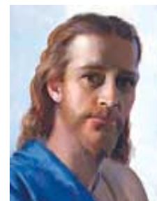
Isus je autor Svetoga Pisma.

Odgovor: Bog koji se u Bibliji spominje (uključujući tu i Stari Zavet) je skoro uvek Isus Hristos. Isus je stvorio svet (Jovan 1:1-3, 14; Kološanima 1:13-17), napisao je Deset Zapovesti (Nemija 9:6, 13), bio je Bog Izrailjaca (1. Korinćanima 10:1-4), i upravljao je pisanje proroka (1. Petrova 1:10, 11). Dakle, Isus Hristos je autor Svetoga Pisma.