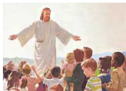
Isus sa večnom ljubavlju ljubi narode na zemlji.

Odgovor: Isus nas sve ljubi sa neopisivom, postojanom ljubavlju koja prevazilazi naše razumevanje.