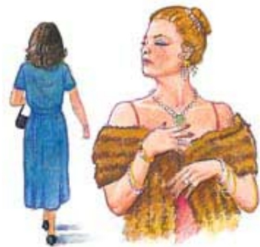
Osobe koje se nisu sasvim predale Isusu neće nikada moći da razumeju hrišćanski način života, pa stoga mi to od njih ne treba ni da očekujemo.

Odgovor: Ne. Isus je rekao da su Božije stvari ludost telesnom čoveku, jer treba duhovno da se razgledaju (1. Korinćanima 2:14). U vezi sa ponašanjem, Isus ima utvrđene principe za one koji očekuju da ih Sveti Duh vodi. Isusov narod će sa zahvalnošću i radošću da sledi Njegov savet. Drugi to možda neće razumeti, niti odobriti.