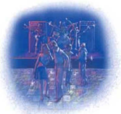
Igranke i plesovi uvek udaljuju od Isusa i duhovnosti.