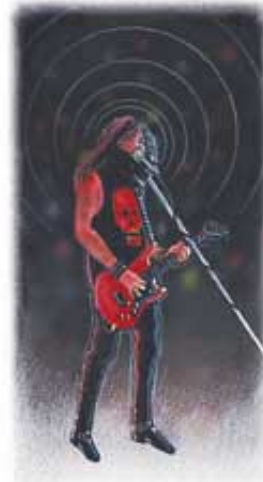
Hrišćani treba da izbegavaju muziku koja uništava želju za pobožni život.

Da li stvari koje gledaš na televiziji, filmovima, ili u pozorištu podržavaju tvoju nižu ili višu prirodu? Da li one povećavaju tvoju ljubav prema Isusu ili prema svetu? Da li proslavljaju Isusa ili sotonske poroke. Danas čak i oni koji nisu Hrišćani govore protiv televizije i filmova. Sotona je zarobio oči i uši milijarde ljudi, a kao rezultat toga je da se ceo svet brzo preobražava u pokvareno mesto nemoralnosti, kriminala, terora i beznadežnosti. Jedno istraživanje je utvrdilo da bi bez televizije u Sjedinjenim Američkim Državama godišnje bilo "10.000 manje ubistava, 70.000 manje silovanja i 700.000 manje napada". 3 Isus, koji te ljubi, od tebe traži da ukloniš oči svoje od sotonskih stvari, jer one utiču na misli, i da ih upraviš na Njega. On kaže: „Pogledajte u mene, i spašćete se.“ Isaija 45:22.