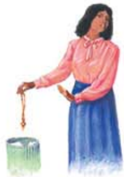
Bog zahteva od Svog naroda da ukloni ukrase i nakit.